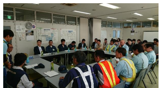
本船作業観察・本船見学後の総括の様子。