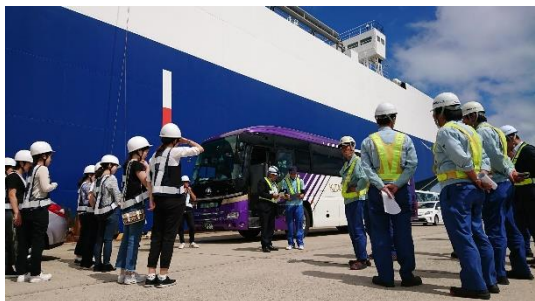
岸壁で説明を受ける参加者の皆様。 (説明:九州営業所、村田)